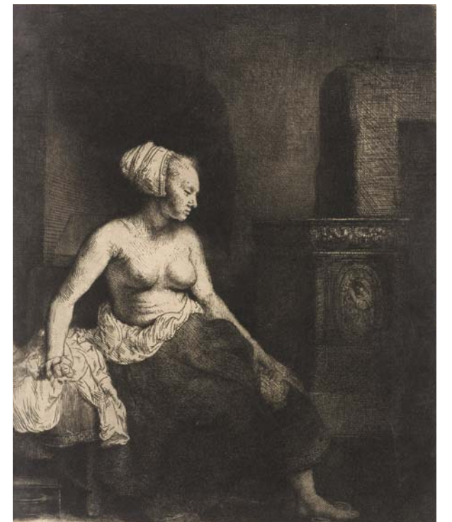
LA FEMME DEVANT LE POËLE

Eau-forte et pointe sèche 1646, Fondation Custodia, Collection Frits Lugt, Paris.