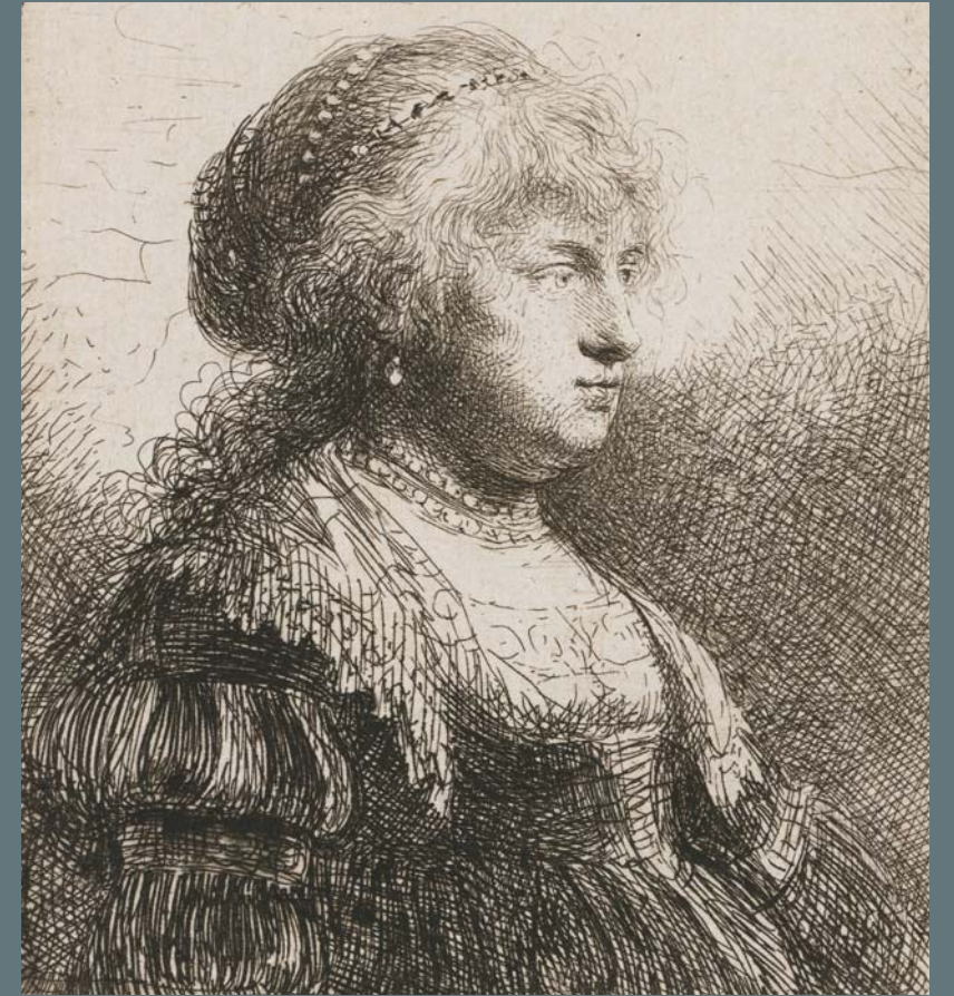
SASKIA AVEC DES PERLES DANS LES CHEVEUX

Eau-forte, 1634, état unique, Petit Palais, Musée des Beaux-Arts de la Ville de Paris. Legs Dutuit, 1902.