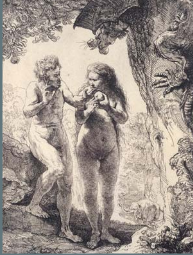
ADAM ET EVE

Eau-forte, 1638, Petit Palais, Musée des Beaux-Arts de la Ville de Paris. Legs Dutuit, 1902.