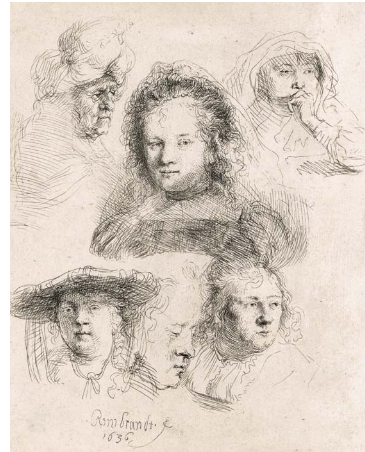
SIX ÉTUDES DE TÊTES DONT CELLES DE SASKIA

Eau-forte, 1634, état unique, Petit Palais, Musée des Beaux-Arts de la Ville de Paris. Legs Dutuit, 1902.