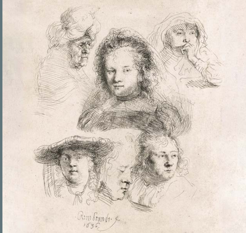
SIX ÉTUDES DE TÊTES DON'T CELLES DE SASKIA

Eau-forte et pointe sèche, 1641, Fondation Custodia, Collection Frits Lugt, Paris.