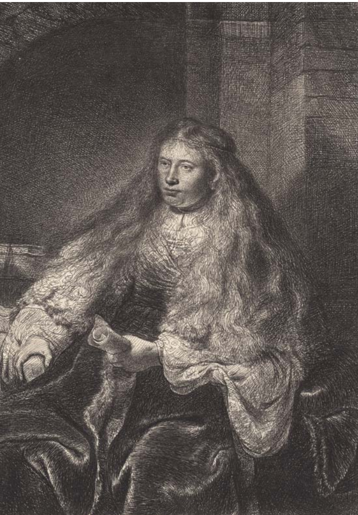
LA GRANDE MARIÉE JUIVE

Glénat nouvellement acquises, elles n'ont pour l'instant pas encore été présentées au public, l'autre partie résulte de prêts parisiens provenant de la collection Lugt conservée à la Fondation Custodia, et de la collection Dutuit conservée au Petit Palais. Ces gravures seront présentées autour de trois thématiques au centre de l'espace de présentation du cabinet Rembrandt.