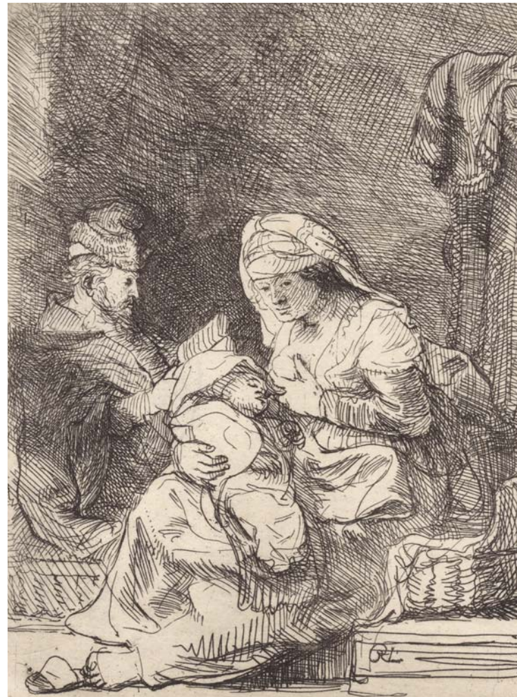
LA VIERGE AU LINGE

Eau-forte, 1635, cinquième état sur cinq.