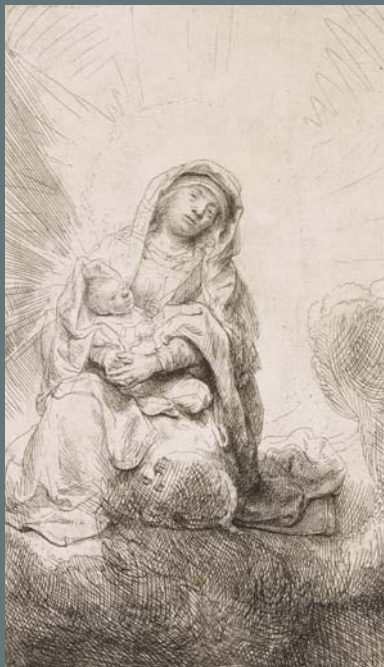
VIERGE À L'ENFANT DANS LES NUAGES

Eau-forte, 1638, Petit Palais, Musée des Beaux-Arts de la Ville de Paris. Legs Dutuit, 1902.