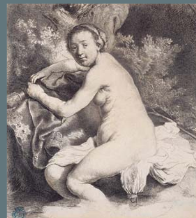
DIANE AU BAIN

Eau-forte, 1633, Fondation Custodia, Collection Frits Lugt, Paris.