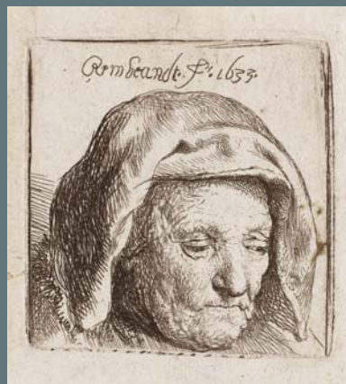
TÊTE DE LA MÈRE DE REMBRANDT

Eau-forte, 1633, Fondation Custodia, Collection Frits Lugt, Paris.