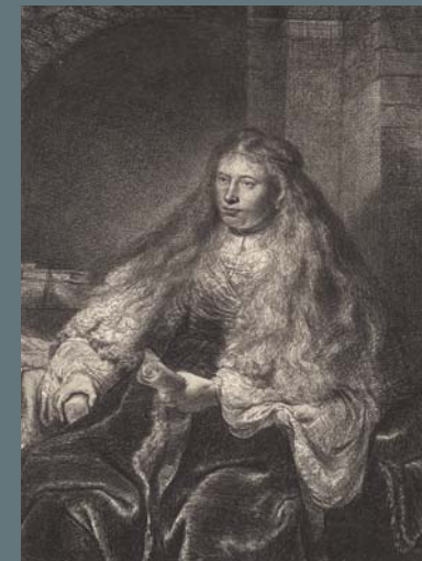
LA GRANDE MARIÉE JUIVE

Eau-forte, 1634, état unique, Petit Palais, Musée des Beaux-Arts de la Ville de Paris. Legs Dutuit, 1902.