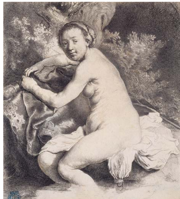
DIANE AU BAIN

Eau-forte et pointe sèche, 1641, Fondation Custodia, Collection Frits Lugt, Paris.