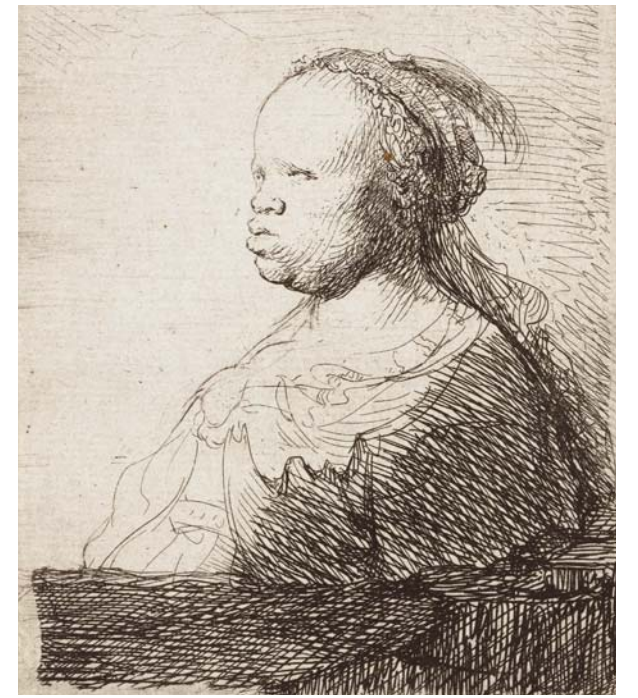
LA MAURESSE BLANCHE

Une grandeur d'âme se dégage alors de ces gravures de l'intime, pleines de sobriété et de réalisme. Rembrandt ne cherche pas à transformer les corps, mais à les dépeindre dans toute leur naturalité.