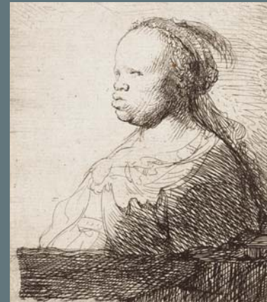
LA MAURESSE BLANCHE

Eau-forte, 1658, Fondation Custodia, Collection Frits Lugt, Paris.