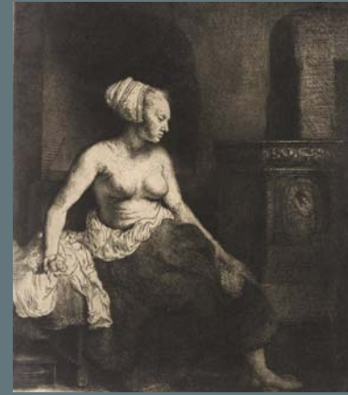
LA FEMME DEVANT LE POËLE

Eau-forte, v. 1631, Petit Palais, Musée des Beaux-Arts de la Ville de Paris. Legs Dutuit, 1902.