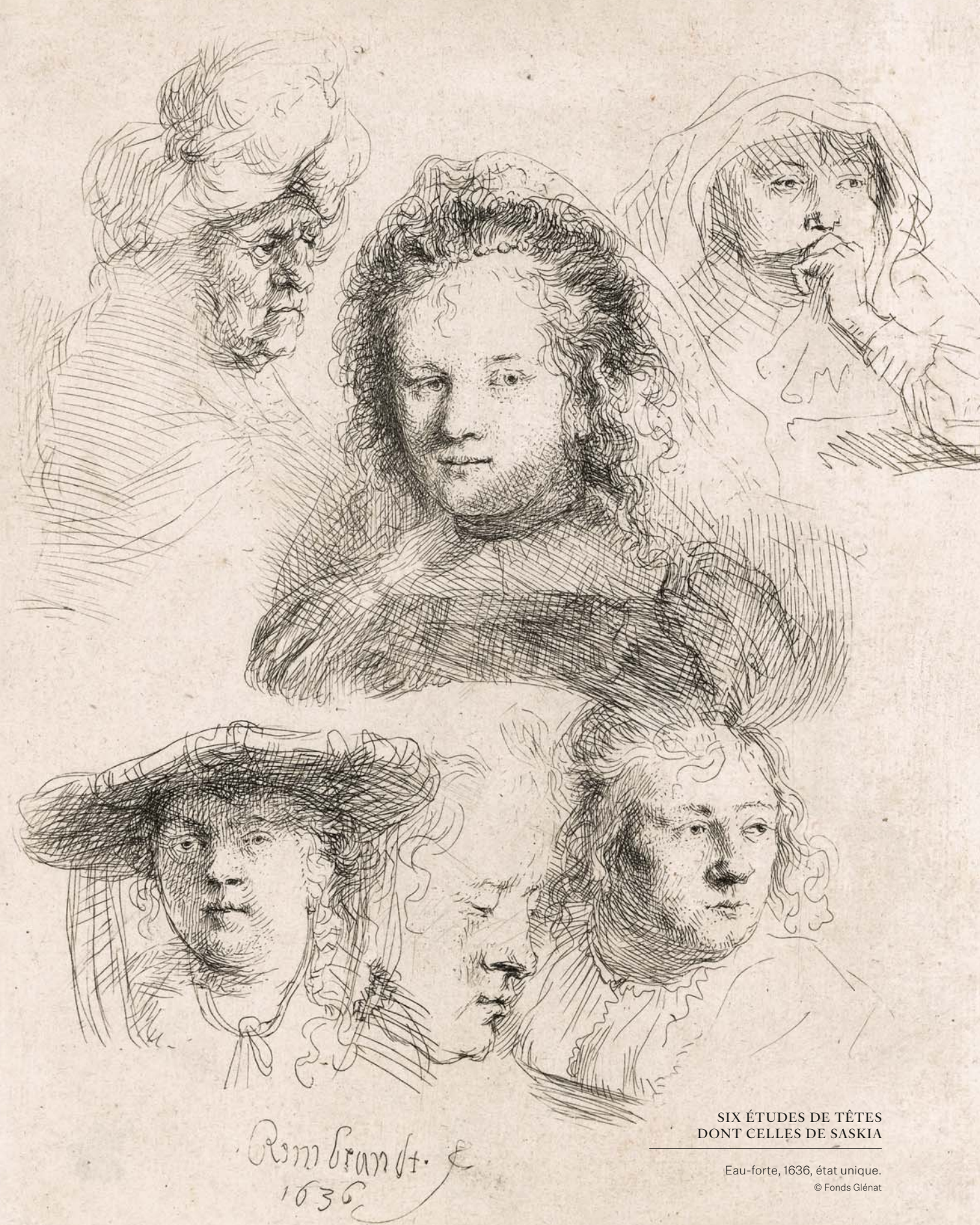
SIX ÉTUDES DE TÊTES DONT CELLES DE SASKIA

Eau-forte, 1636, état unique.