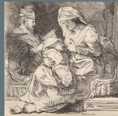
LA VIERGE AU LINGE

Eau-forte v. 1630, Fondation Custodia, Collection Frits Lugt, Paris.