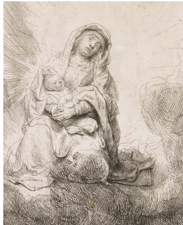
VIERGE À L'ENFANT DANS LES NUAGES

Eau-forte, deuxième état sur deux, 1638, Petit Palais, Musée des Beaux-Arts de la Ville de Paris. Legs Dutuit, 1902.