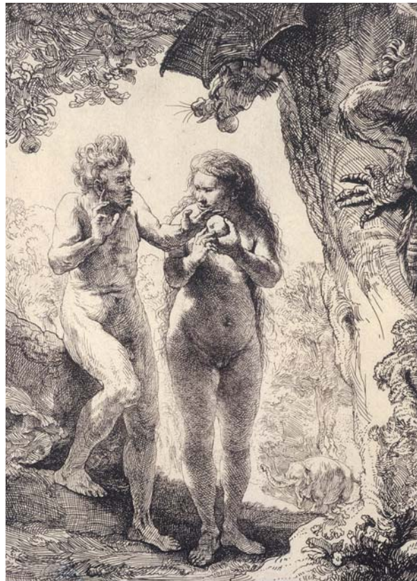
ADAM ET EVE

Eve, Diane ou Marie, elles nous paraissent étonnamment proches et nous parlent de l'humain qui habite en nous, de ce qu'il a de simple et de sublime, de vulnérable et de vibrant. En retour les femmes gravées dans leur quotidien se chargent d'une aura sacrée, d'une lumière qui les transfigure.